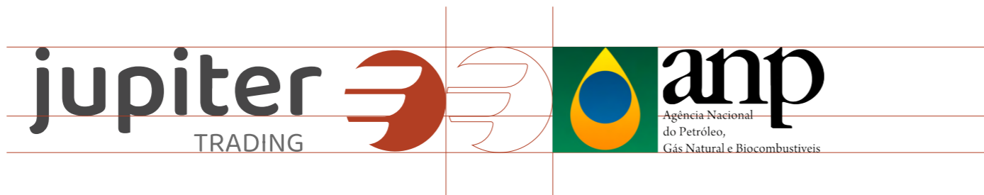
Margem de convivência horizontal